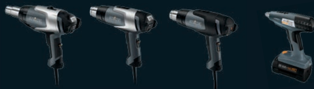
HG 2520 E