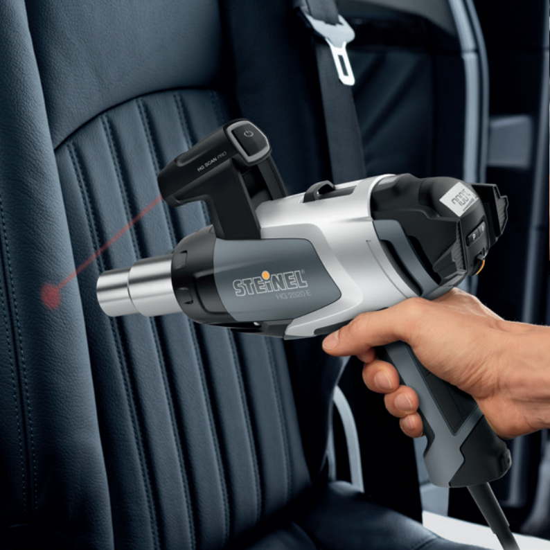
▲ Bőrsimítás HG 2520 E