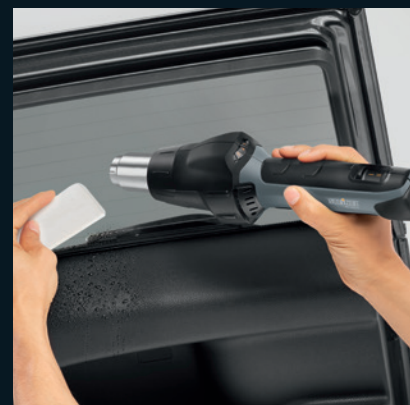
▼ Fóliázás HG 2220 E