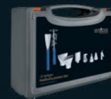
12 részes forrólevegő tartozékkészlet EAN 4007841 075569