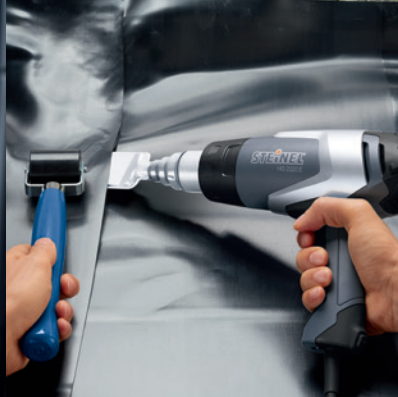
▲ Tófolia-hegesztés HG 2320 E