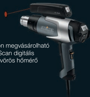
Külön megvásárolható HL Scan digitális infravörös hőmérő