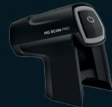
HG Scan PRO HG 2520 E-hez