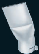
Szögben hajlított, lapos fúvóka, 74x3 mm EAN 4007841 092818