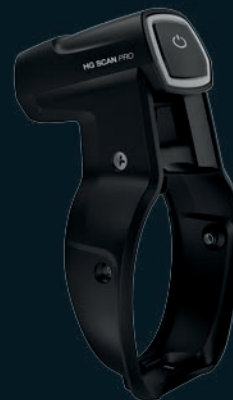
HG Scan PRO HG 2620 E-hez

Hosszúság/szélesség/mélység HG 2520 E-hez . . . . . 88 mm x 56,5 mm x 77 mm EAN HG Scan PRO HG 2520 E-hez. . . . . 4007841 007690