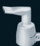
Szögben hajlított, lapos fúvóka, 20x2 mm, 100° EAN 4007841 007812