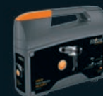
Kofferben is kapható

Hosszúság/szélesség/mélység: . . . . . 253 mm x 86,5 mm x 200 mm EAN HG 2320 E . . . . . 4007841 007386 EAN HG 2320 E kofferben, reflektorfúvókával 50 mm-es széles fúvókával, 9 mm-es szűkítő fúvókával és zslugortömlőkkel . . . . . 4007841 351502