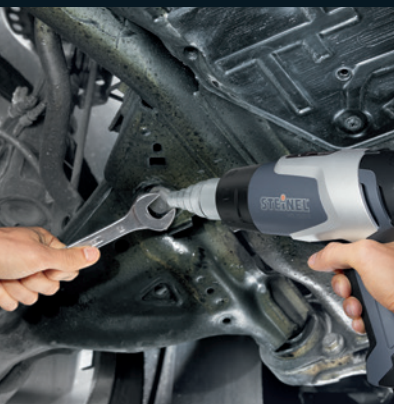
▼ Csavarok meglazítása HG 2320 E